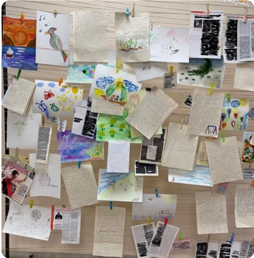
Я могу создавать