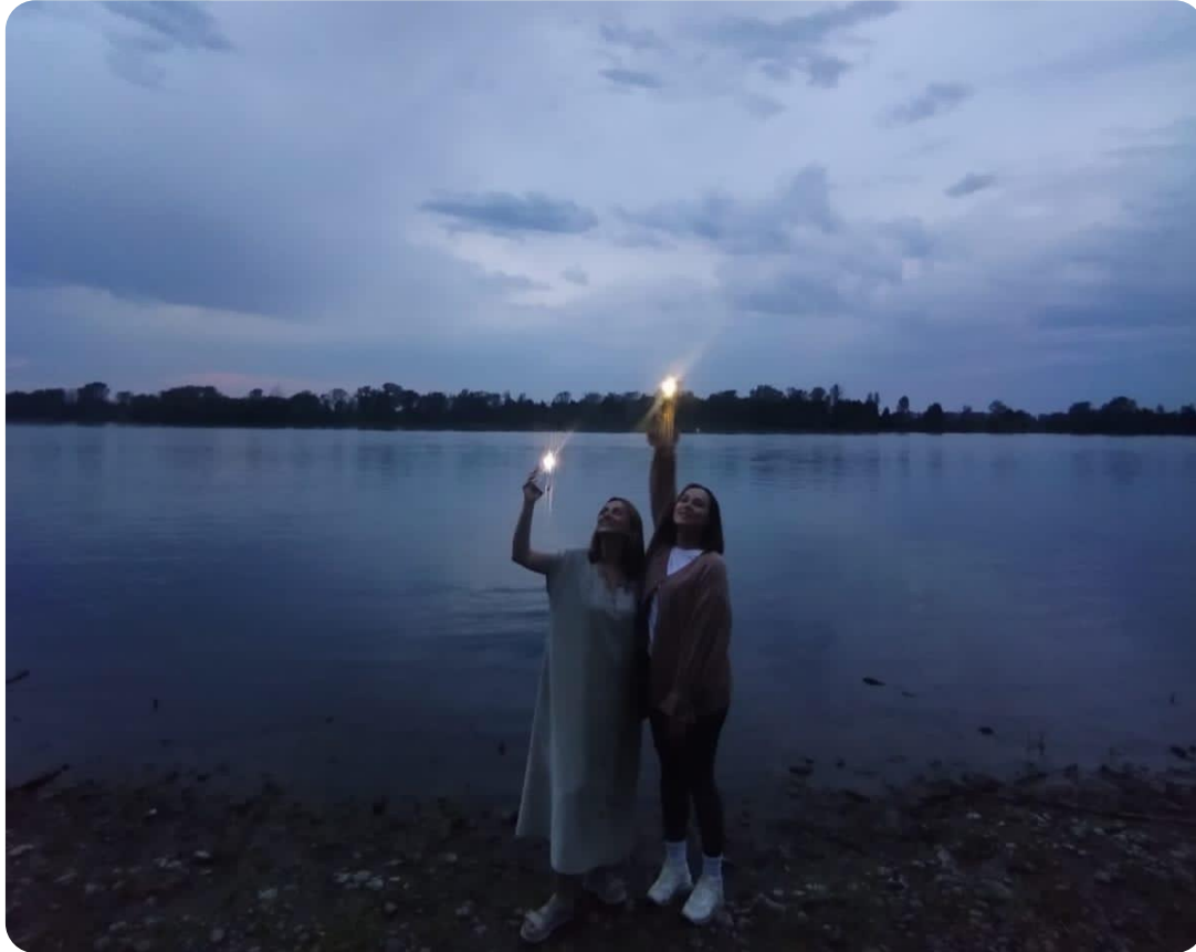
Отрыв от повседневной жизни и работы