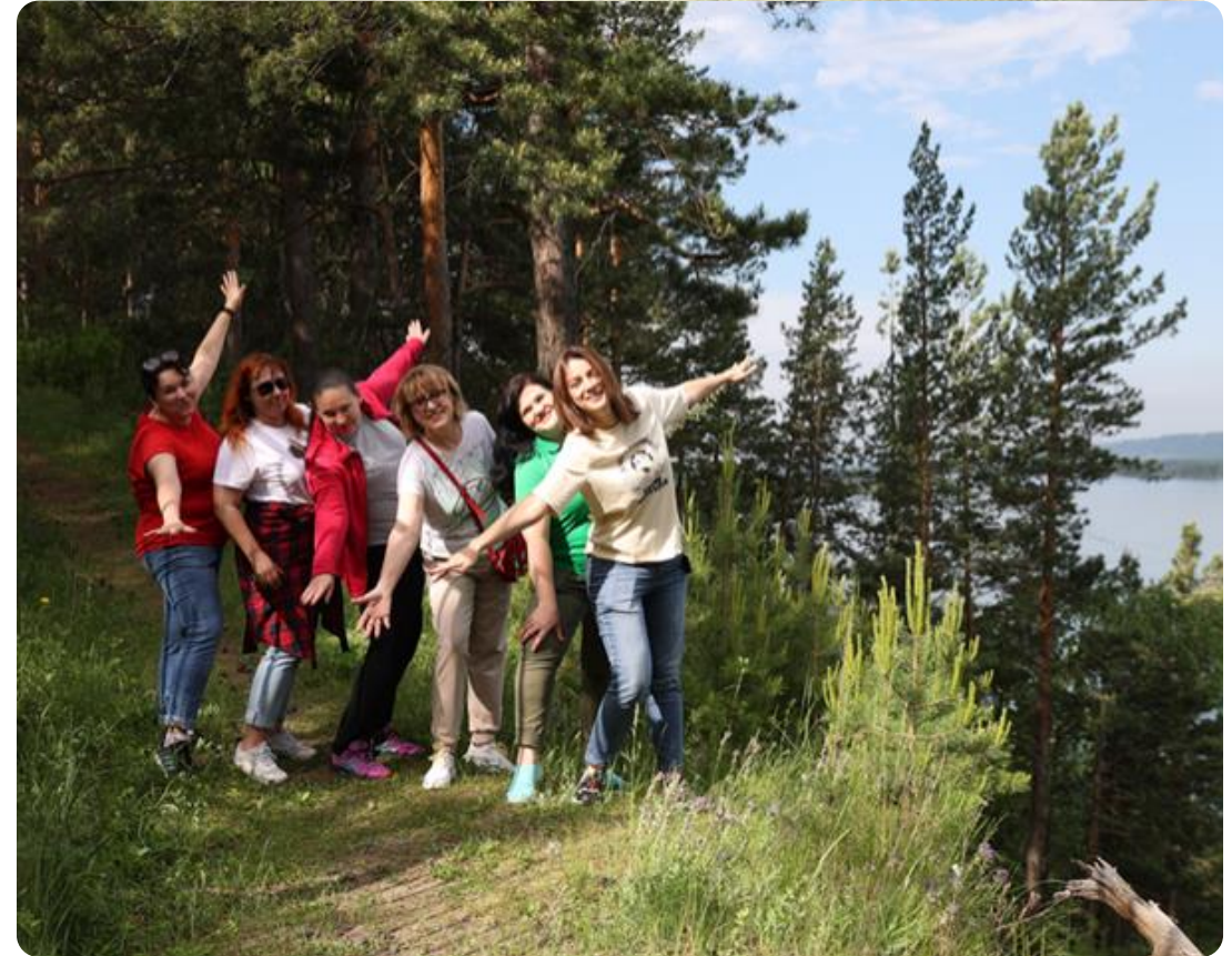
Выезд в специальное, настоящее, не напрямую обучающее / неформальное место