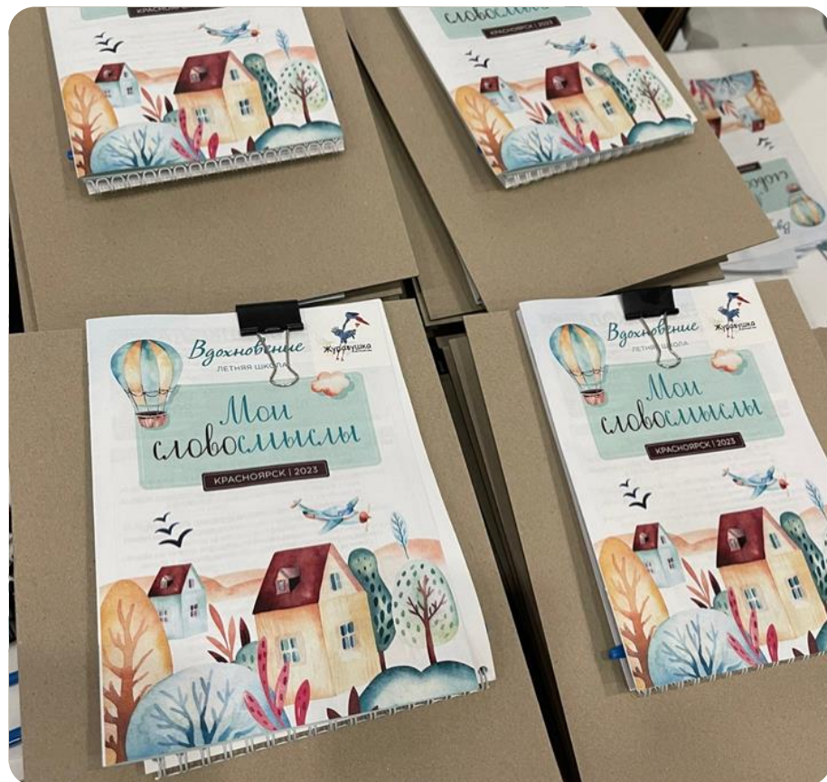
Летняя школа 2023 г. «Я вдохновляюсь словом»